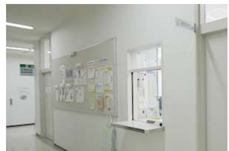
LL・視聴覚準備室（11号館2階）