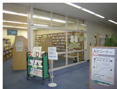
AVコーナー（図書館2階）