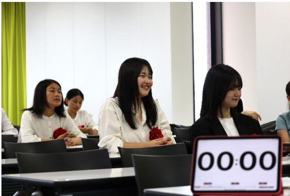
出場した学生のスピーチを聞く様子