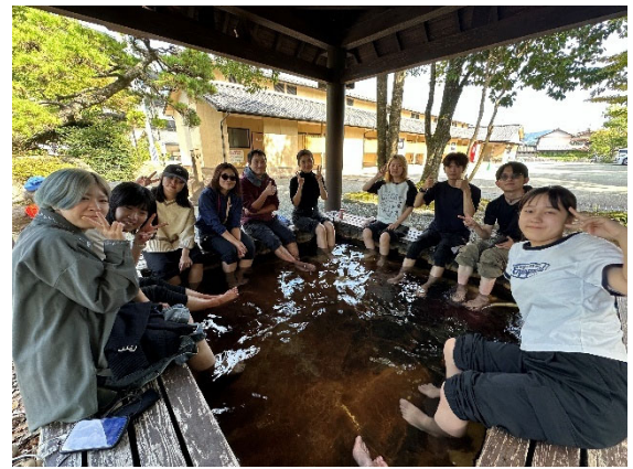
登山後の足湯タイム