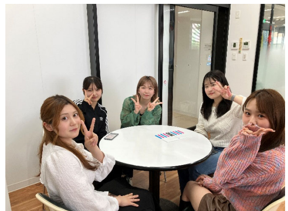
留学生ルームにて