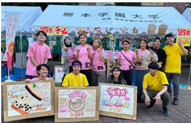
留学生チームのブース前で