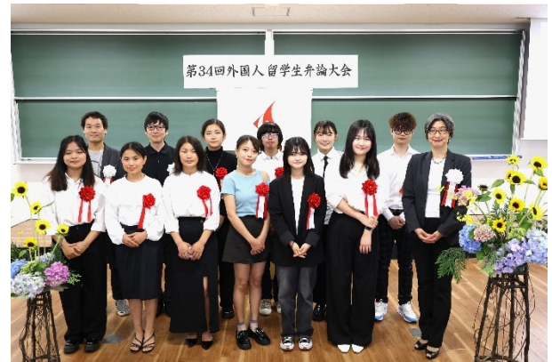
みなさん頑張りました！