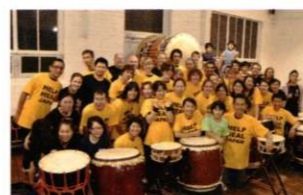
Australia Wadaiko RINDO 2011「津波コンサート」で メルボルンから東日本大震災被災地へ 募金が届けられました。